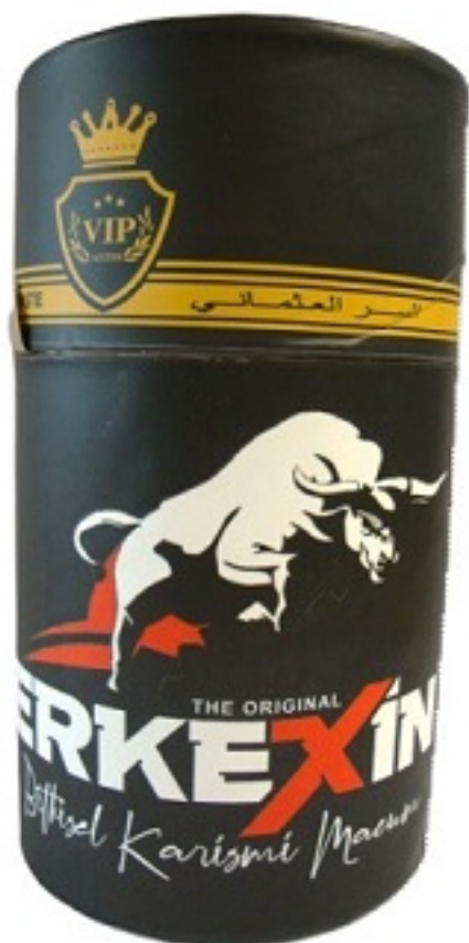
Imagen del producto Erkexin