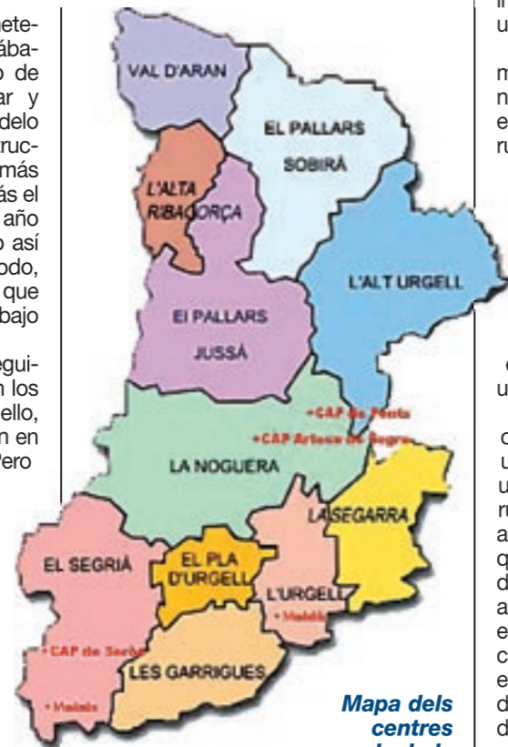
Mapa dels centres rurals de la província de Lleida que han tingut residents

cada una de las rotaciones pertenece a la experiencia individual de cada uno de nosotros.