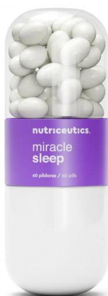
Fig.1: Imagen del producto MIRACLE SLEEP píldoras.

La prohibición de la comercialización y la retirada del mercado de todos los ejemplares del citado producto.